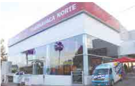
Toyota Cuernavaca Norte.