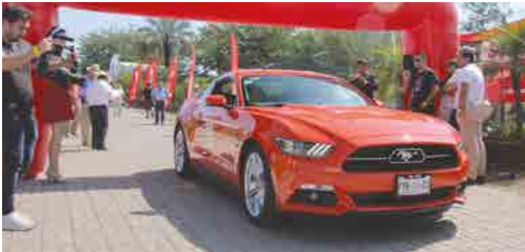
La salida y meta fue en Jardines de México.