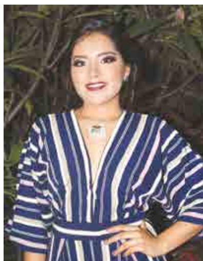
Preciosos diseños de joyería en plata.

Después de la pasarela, la anfitriona invitó a todos a visitar el sitio web: www.amoripau.mx y más tarde en conjunto con los patrocinadores, se organizó una rifa con la que dieron a conocer sus productos y servicios.