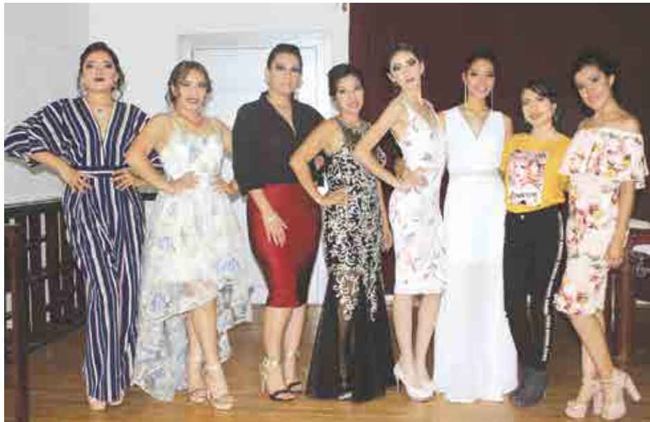
Modelos que participaron en la pasarela de la marca Amoripau Co.