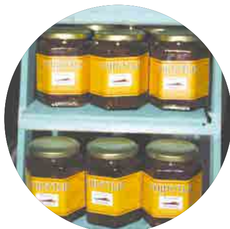
Chipotliz, uno de los patrocinadores.