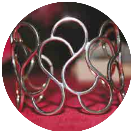
Los diseños son totalmente originales de la marca Amoripau Co.