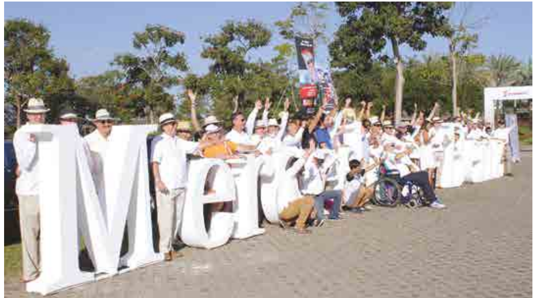
Se reconoció y celebró el 25 aniversario de Mercedes Benz en México, así como los 30 años de la Comisión Nacional Vintage.