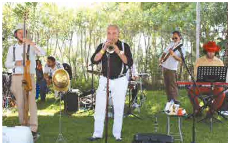
Magnolia México Jazz Band.

Para finalizar las actividades, se hizo entrega del premio Vintage Top Ten Cars y los asistentes hablaron de sus experiencias, disfrutaron la música en vivo, así como una excelente gastronomía.