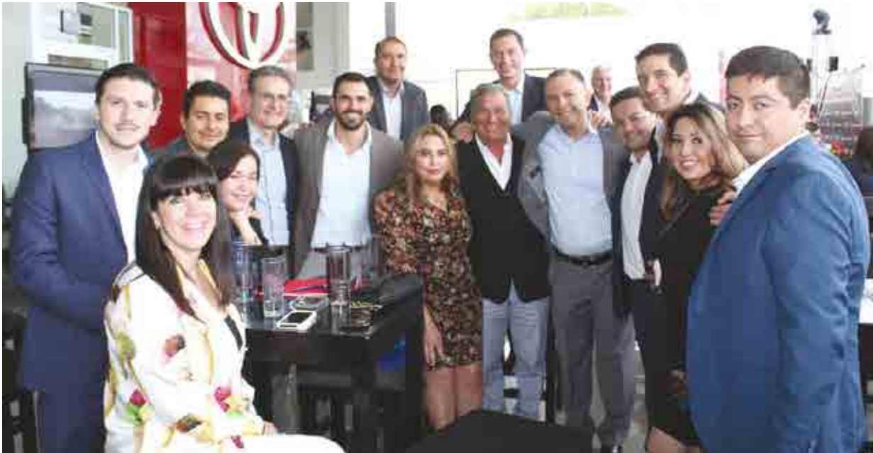
Equipo Toyota Motors.