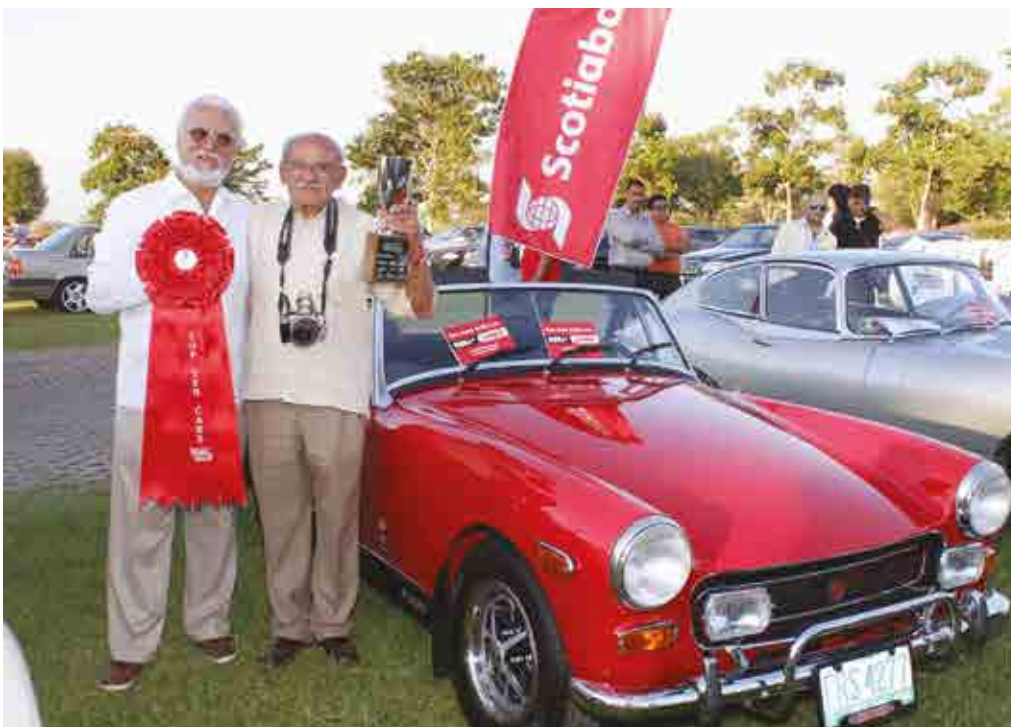
Se hizo entrega del premio Vintage Top Ten Cars.