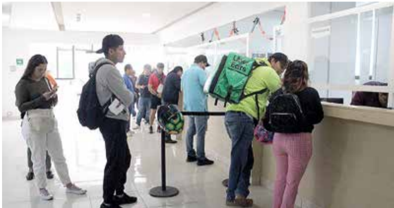
UNAS 40 MIL placas serán entregadas a automovilistas tras la reanudación de los trámites en la CGMT.