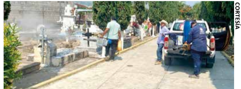
LOS TRABAJOS SE realizan en los 13 panteones del municipio.

» El objetivo es evitar la propagación de contagios de dengue