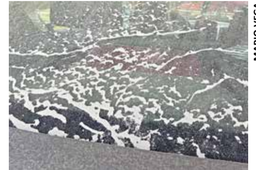
Siete municipios registraron la caída de ceniza volcánica este jueves.

» Autoridades recomiendan adoptar medidas de prevención