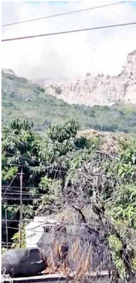
LA ZONA DONDE se originó la explosión.

El grupo de afectados aseguró que se ha he-