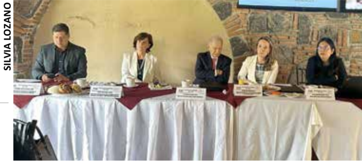
EL INE MORELOS presentó la Estrategia Nacional de Educación Cívica 2024-2026.