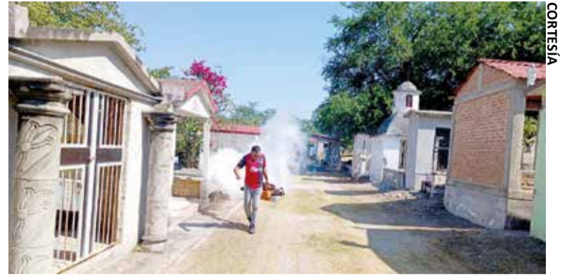
BRIGADAS MUNICIPALES RECORRIERON todos los panteones locales para llevar a cabo diversas acciones.

» Realizaron labores de limpieza y acciones para combatir el mosquito transmisor del dengue