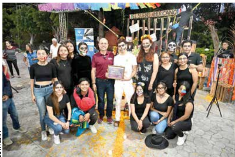
EL ALCALDE POSÓ con los ganadores del concurso.

Los cinco ganadores del concurso recibieron premios económicos por su creatividad, originalidad y diseño. El Centro Universitario Intera-