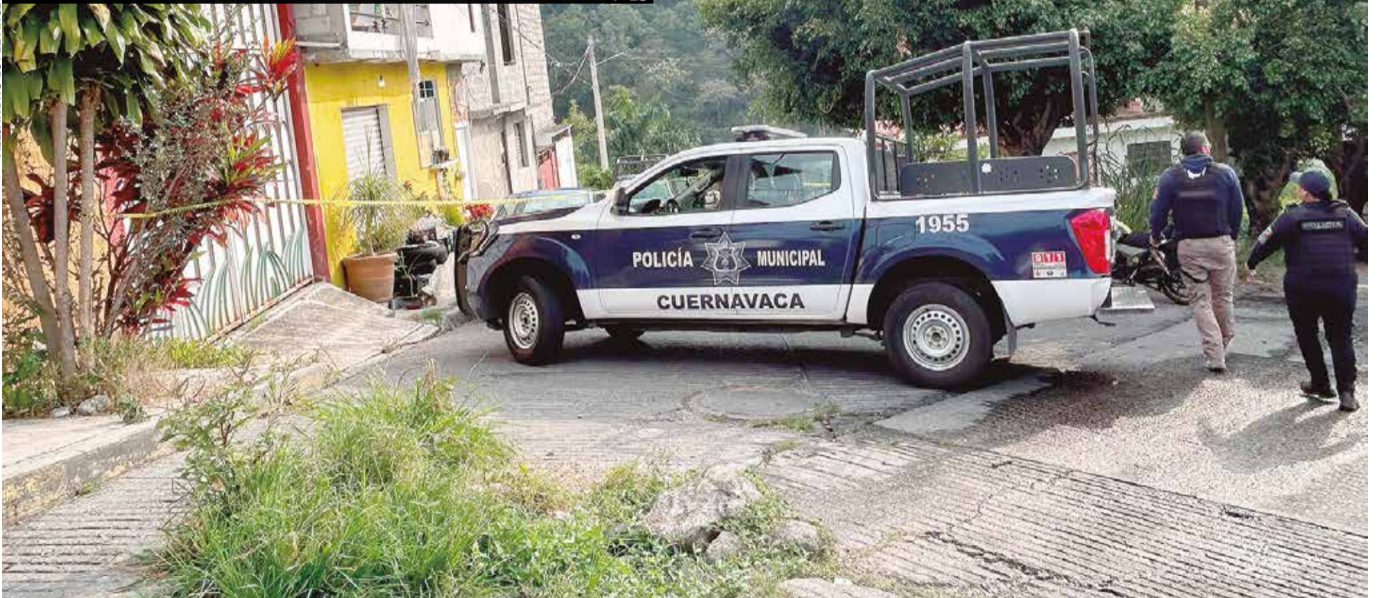
EL DOBLE HOMICIDIO tuvo lugar en la calle Juventino Rosas, la mañana del jueves.