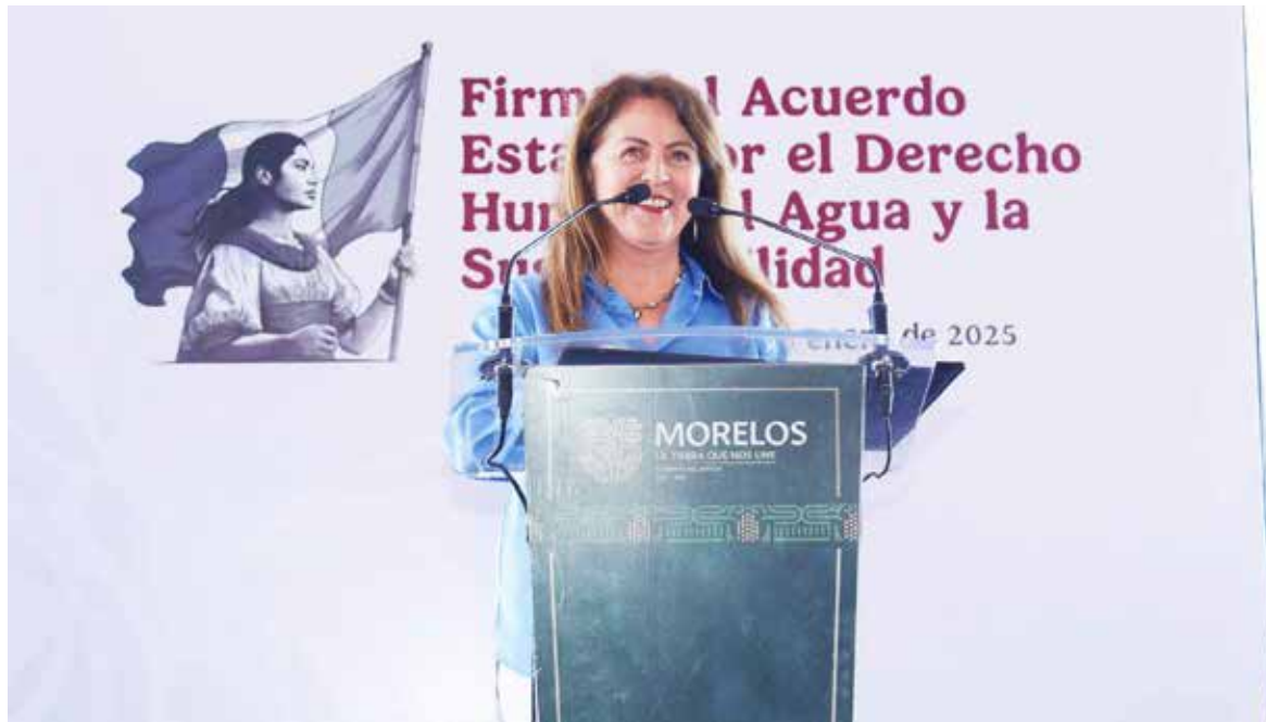
LA GOBERNADORA MARGARITA González Saravia presentó la terna ante el Congreso del estado.