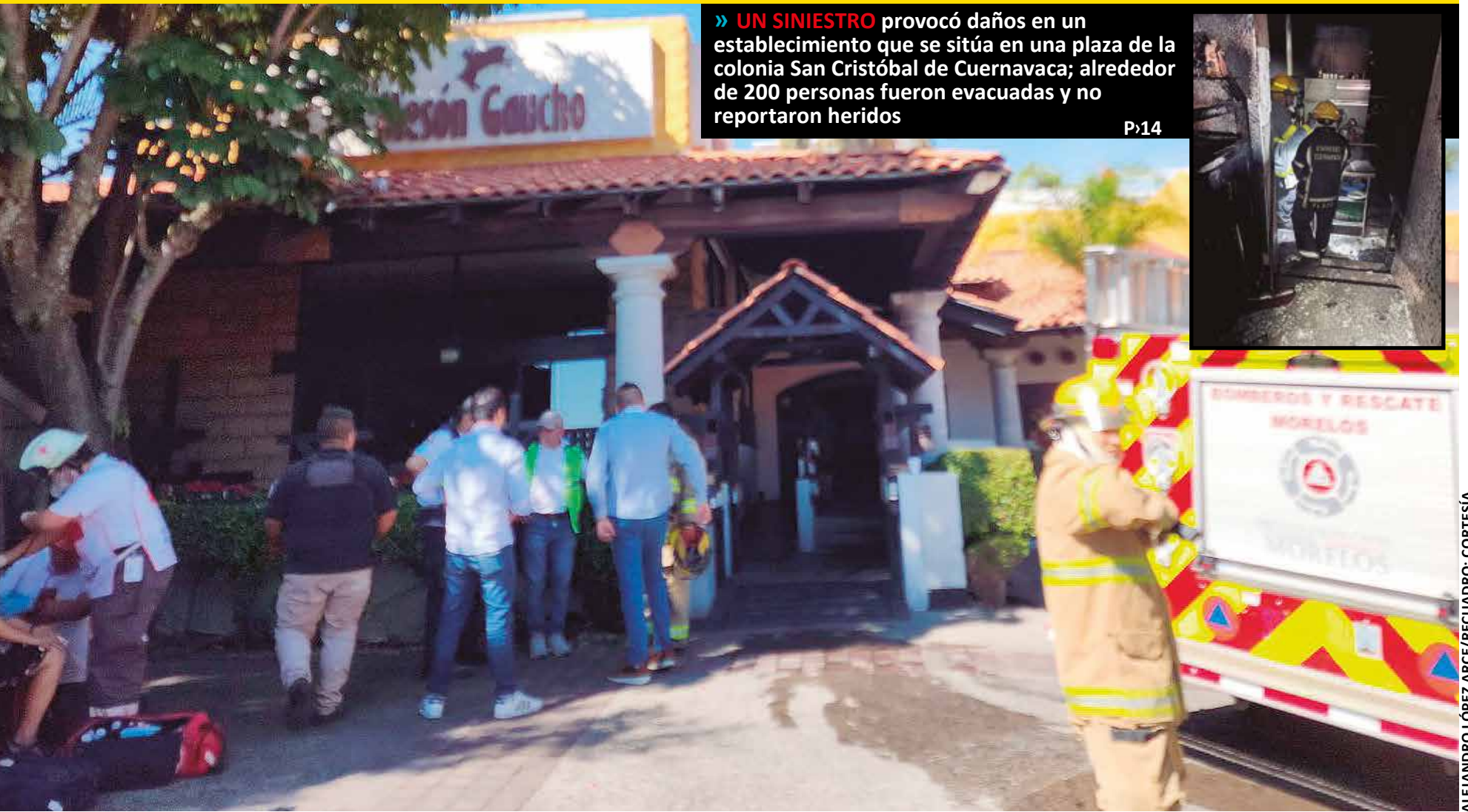
EL HECHO PROVOCÓ la movilización de diversos cuerpos de auxilio y rescate, la tarde del martes.