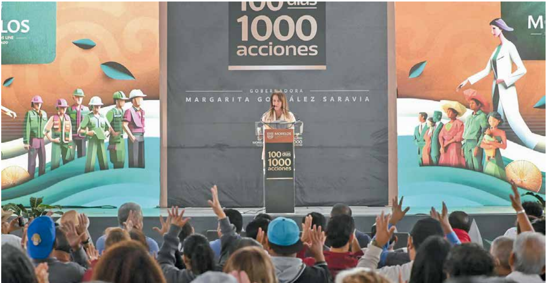
• Informe de la gobernadora Margarita González Saravia.

Además agregó “Gracias a todas y todos por acompañarme este día. Ustedes son la razón principal por la que nos dedicamos al noble oficio de la política. Les refrendo mi encargo de trabajar con responsabilidad, honestidad y entrega ¡Las y los quiero mucho!”.