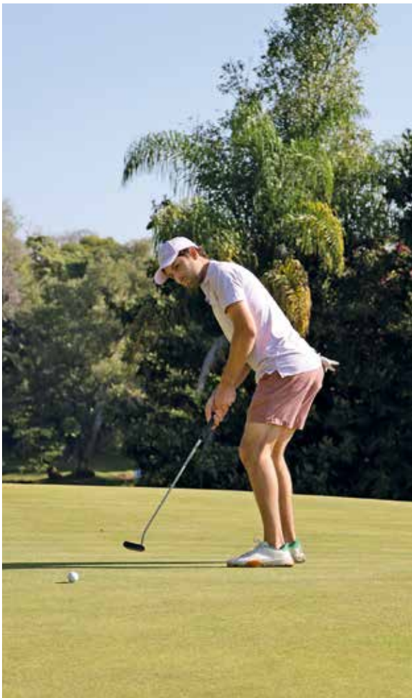
• Héctor Slim.