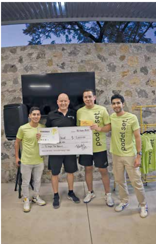
• Segundo lugar, 5ta varonil.

1ER TORNEO INAUGURAL DE PÁDEL SET VISTA HERMOSA