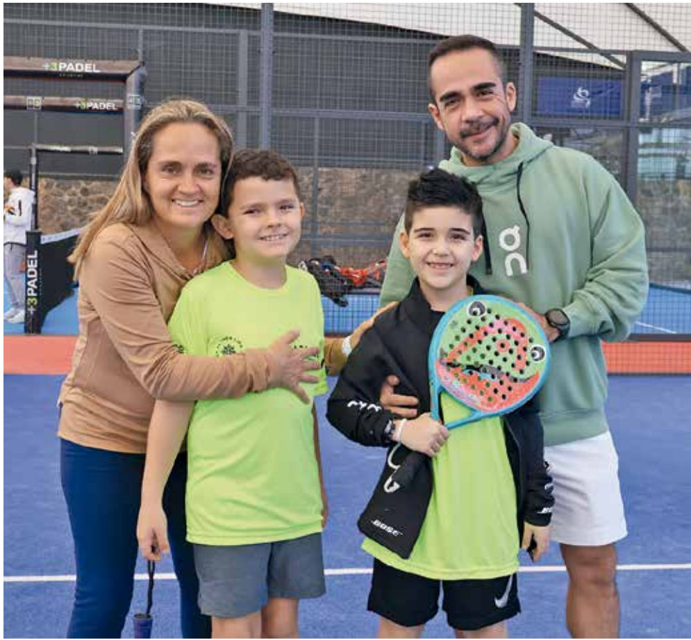
• Padres con sus hijos.

E n el Club de Padel +3 ubicado en la colonia Vista Hermosa, se llevó a cabo el Primer Torneo Estatal de Morelos, convocado por la Federación Mexicana de Pádel (Femepa) con el objetivo de reunir a los mejores padelistas morelenses y que puedan participar en el Circuito Nacional.