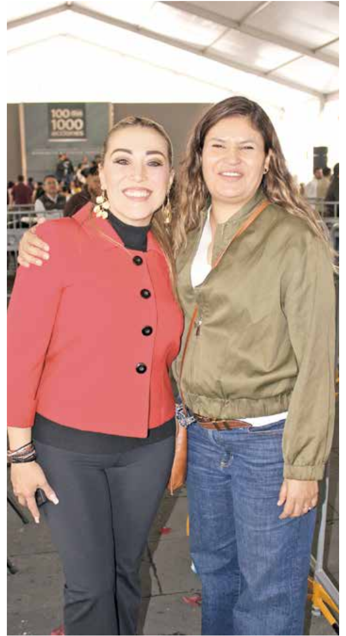
• Penélope Picazo y Paula Mantecón.

“Estos primeros 100 días han sido de trabajo intenso, de decisiones firmes y de cercanía con cada sector de nuestra sociedad. Hemos sembrado la semilla de la transformación y, aunque los frutos tomarán tiempo en madurar, hay avances claros y resultados tangibles que reflejan el compromiso de este gobierno con la dignidad humana, la equidad y el desarrollo de todas y todos”, puntualizó la mandataria estatal.