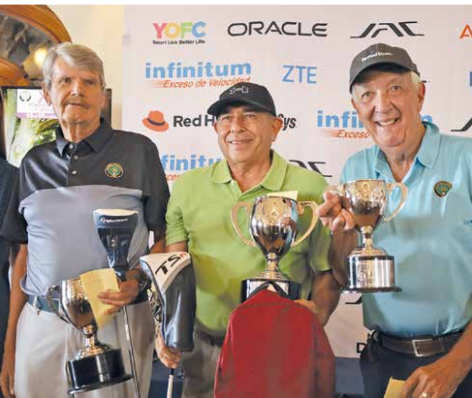
• Ganadores categoría Senior.