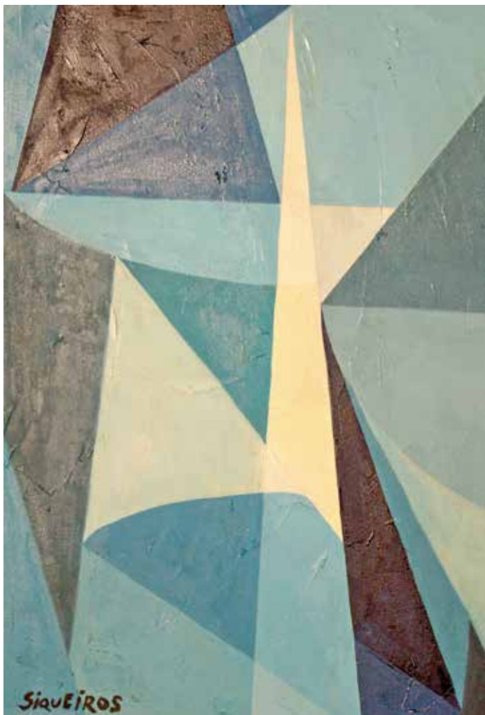
• Obra de David Alfaro Siqueiros.