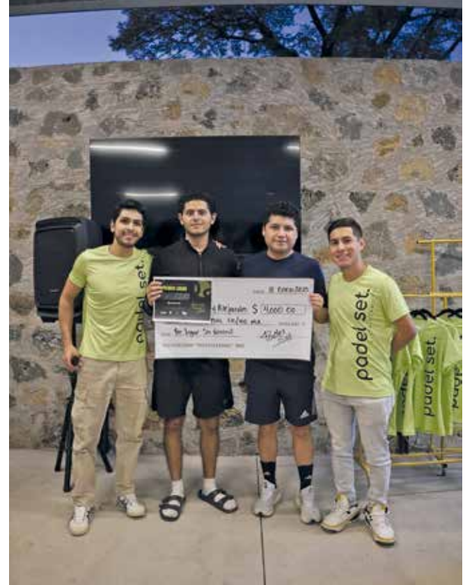
• Primer lugar, 5ta varonil.