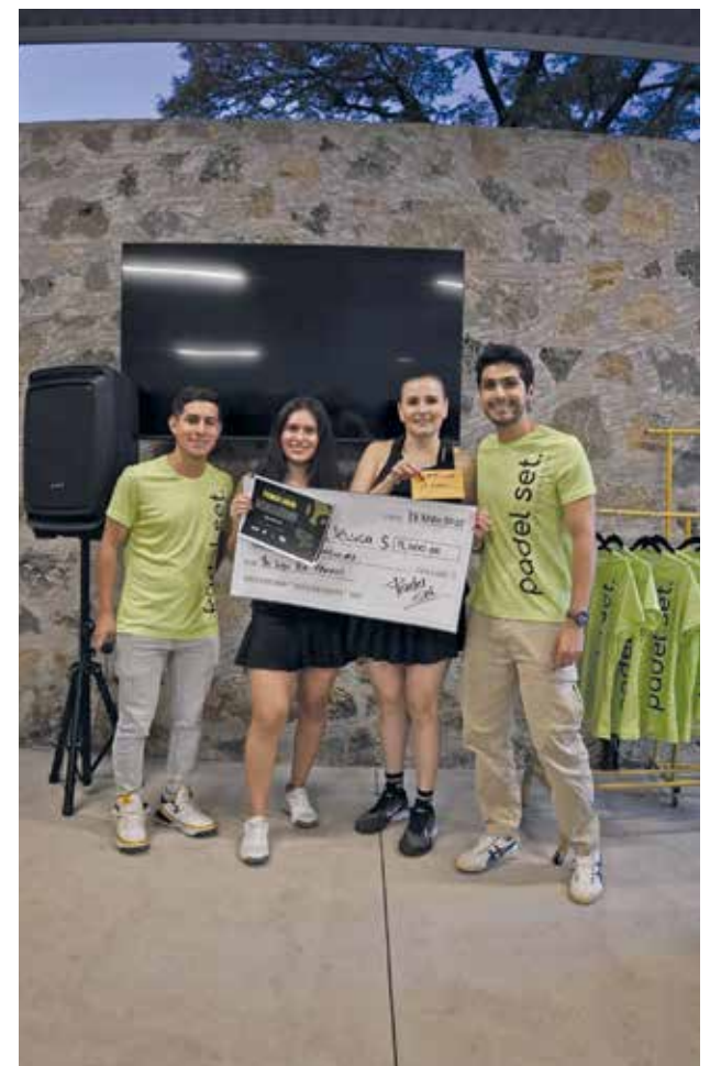
• Primer lugar, 6ta femenil.

Se destacó y reconoció a sus alumnos inscritos quienes con su talento, pasión y espíritu competitivo dieron lo mejor en la cancha, demostrando que el pádel es más que un deporte: es una forma de vida. Cada jugador estuvo acompañado de amigos y familiares a lo largo del torneo, cuya energía y entusiasmo crearon un ambiente inolvidable.