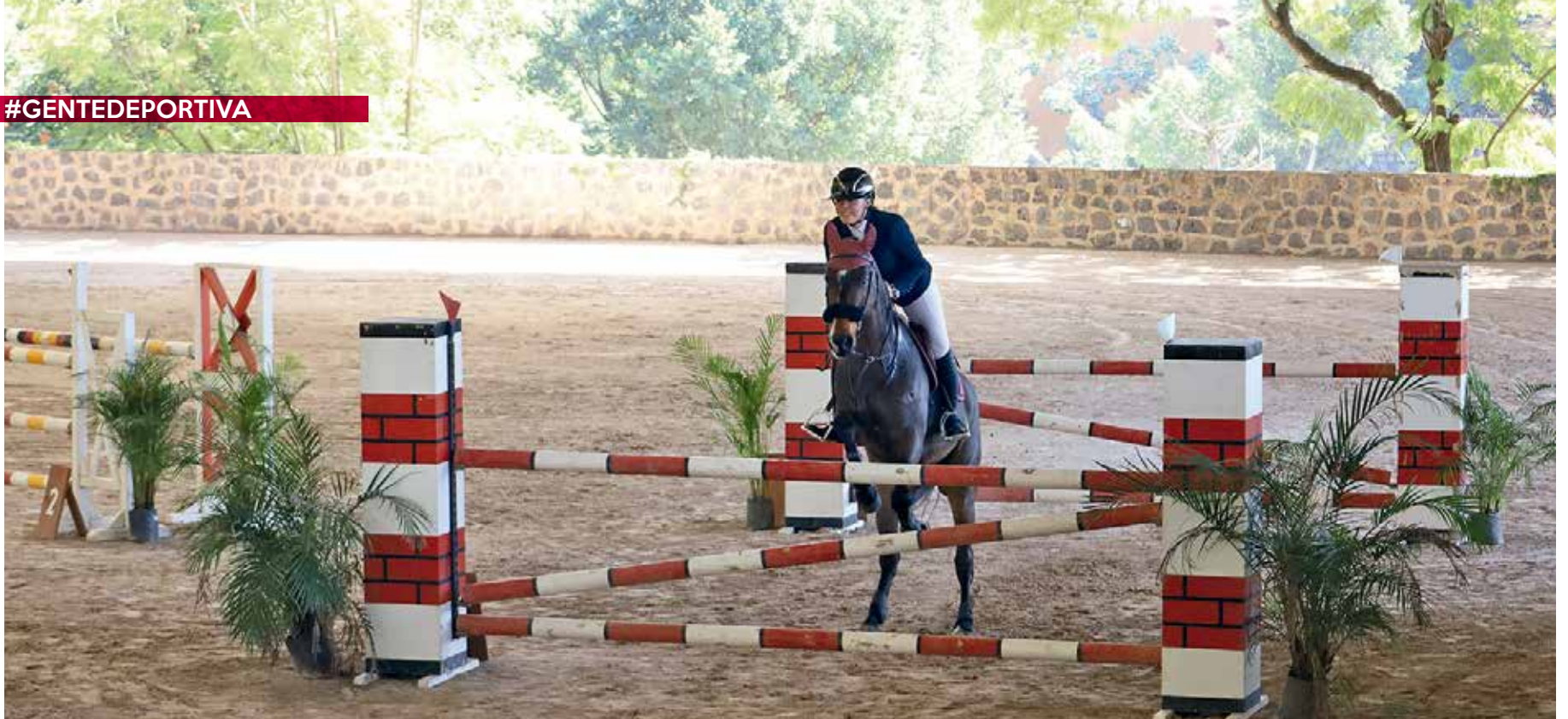
• Prueba de 1.20 m.