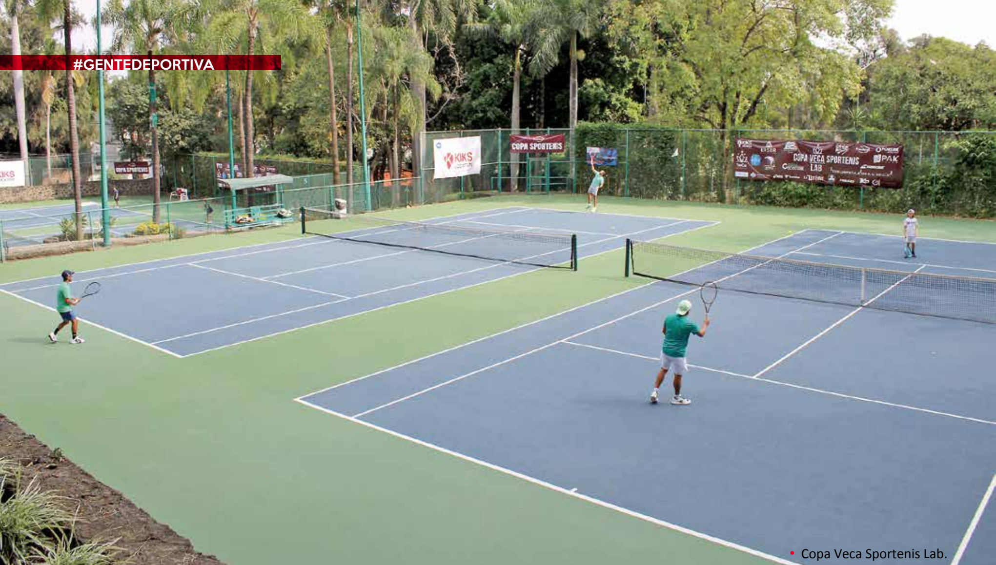
• Copa Veca Sportenis Lab.