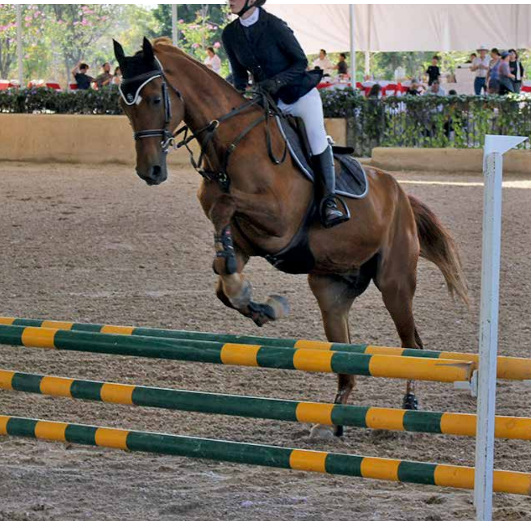
• Postales de los saltos engalanaron la Cuarta Fecha.

ESPECTACULAR CIERRE DE AÑO EN EL CLUB HÍPICO VISTA HERMOSA