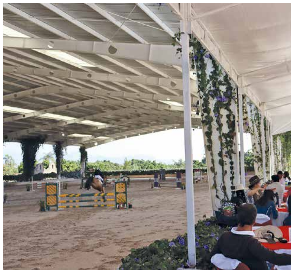
• Cuarta Fecha del Circuito Vista Hermosa 2024.