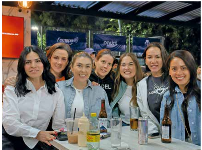
• Gran ambiente.