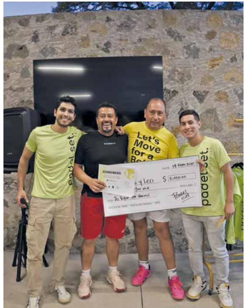
• Segundo lugar, 6ta varonil.