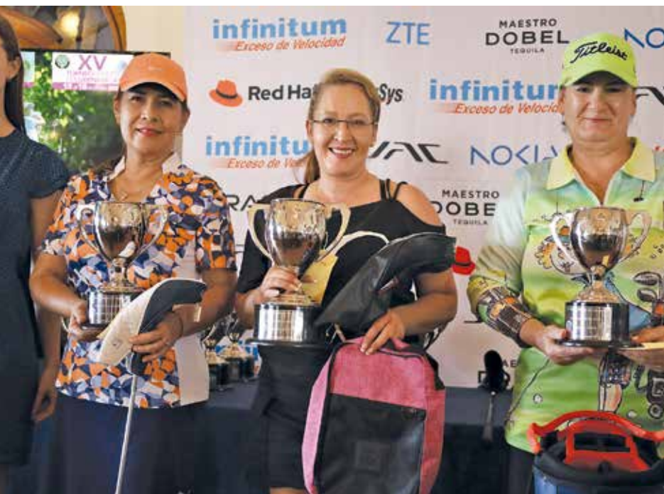
• Ganadoras categoría Damas.

El éxito de esta XV edición no solo se midió en términos deportivos, sino también en la hospitalidad y el ambiente acogedor que vivieron todos los asistentes. Sin duda, el Torneo Abierto de Cuernavaca sigue consolidándose como un punto de encuentro clave para los amantes del golf, quienes ya esperan con entusiasmo la próxima edición.