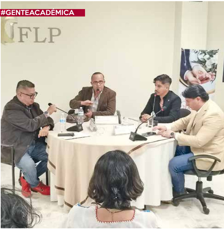
• Compartieron diversos puntos de vista sobre sus carreras.