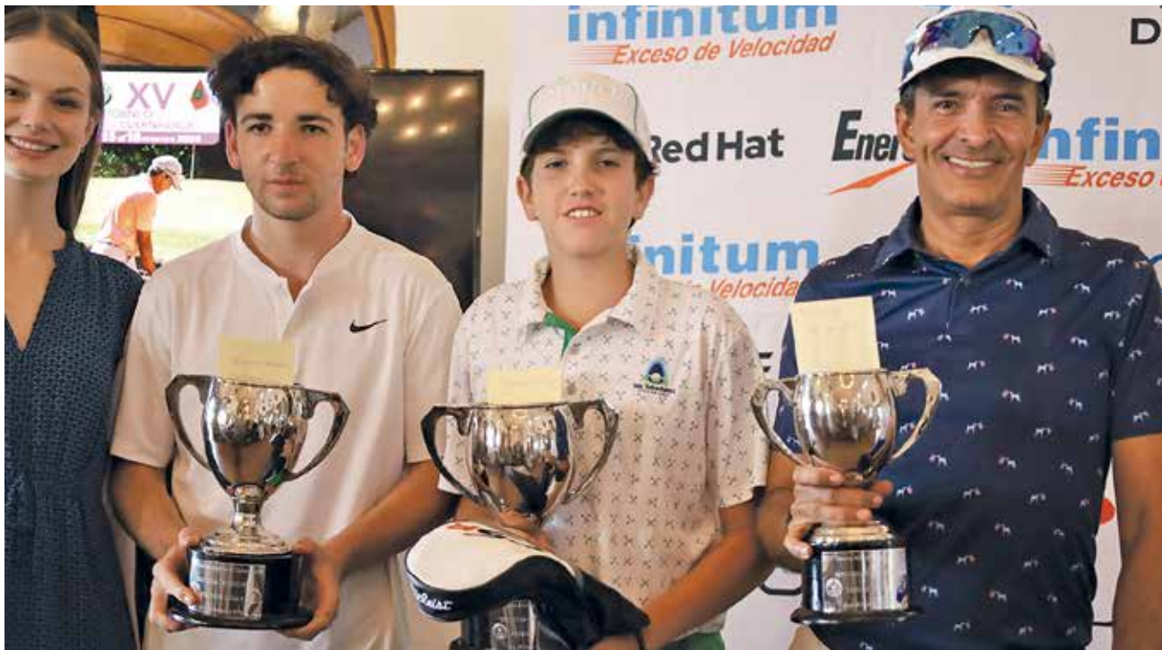
• Ganadores categoría Caballeros 2ª.

El éxito de esta XV edición no solo se midió en términos deportivos, sino también en la hospitalidad y el ambiente acogedor que vivieron todos los asistentes. Sin duda, el Torneo Abierto de Cuernavaca sigue consolidándose como un punto de encuentro clave para los amantes del golf, quienes ya esperan con entusiasmo la próxima edición.