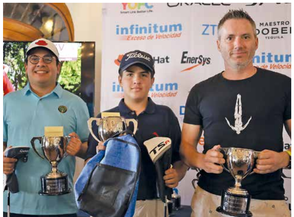
• Ganadores categoría Caballeros 3ª.