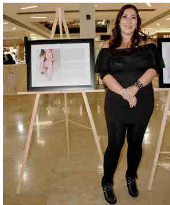
Exposición de Carina Favela.